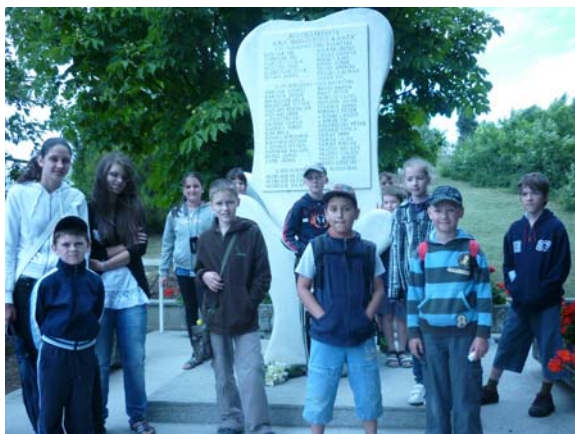
A résztvevők egy csoportja a Hősök Emlékművénél